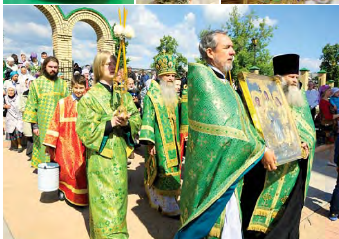
Крестный ход вокруг храма Святой Троицы

– В День Пятидесятницы благодать первыми получили апостолы и те, кто в этот день были с ними. Потом этот огонь начал распространяться по всему миру – среди людей. То есть в нас загорается этот огонь, разгорается и живет, когда мы общаемся с Богом и учимся у наших свя-