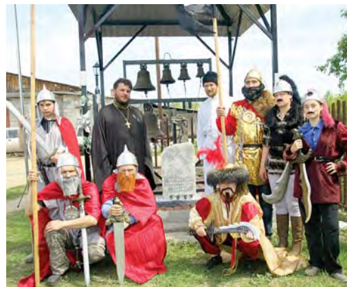
Участники исторической реконструкции