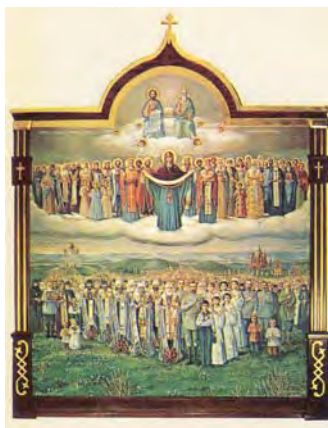
Икона в память новых мучеников российских

колай II со своей семьёй, как монарх, возглавляющий Российский престол. Пресвятая Богородица с омофором в руках в окружении сонма святых встречает этих новомучеников. Над всеми сими на облаках восседает Святая Троица. Автор – иконописец Петр Задорожный.