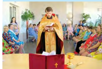
В перинатальном центре

Батюшка поздравил всех будущих мам с Пасхой, отслужил молебен, произнес прошения ко Господу и Божией Матери в помощь роженицам. Потом окропил женщин святой водой для духовного подкрепления в предстоящих испытаниях: