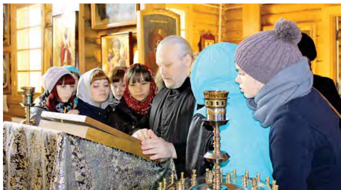
Общение с батюшкой

Руководствуясь принципом «лучше поздно, чем никогда», преподаватели техникума начали курс нравственного воспитания. Мы с девушками посетили все музеи города, побывали в театре, поиграли в пейнтбол. А потом пошли в Свято-