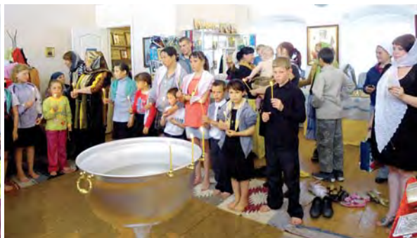
Таинство крещения в храме Сретения Господня

На бывшей территории монастыря сейчас располагается коррекционная школа-интернат, где учатся дети с ограниченными возможностями здоровья. Многие из них изъявили желание принять крещение, родители их поддержали.