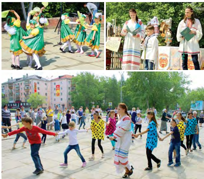
Праздник на городской площади Асбеста