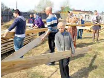
Молодежь на субботнике

В этот же день сотрудниками ДПЦ «Древо познания» совместно с семейным клубом «Солнышко» и молодежным клубом «Свеча» была организована уборка территории вокруг здания центра.