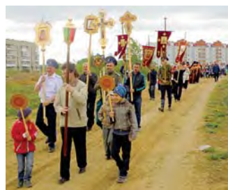
Крестный ход в Артемовском

Было провозглашено многолетие Патриарху Кириллу, т. к. отмечался день его тезоименитства. А за-