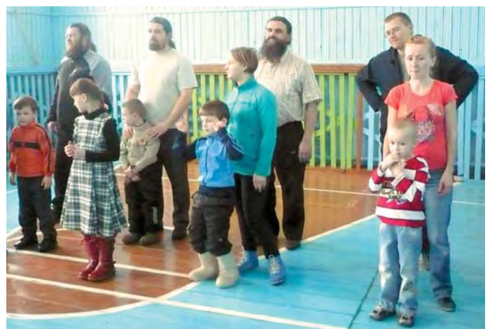
Семьи вышли на старт

Целый час участники состязались в ловкости, меткости, скорости и выносливости, с честью выполняя задания: «Сороконожка», «Челночок», «Папа-мама-биль», «Пингвин» и т.д. Надо сказать, что папы-священ-