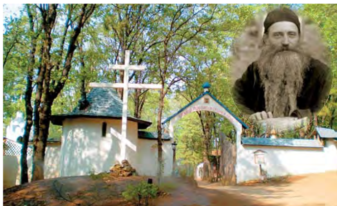
Монастырь в честь Германа Аляскинского

В монастыре нет электричества и водопровода. Братия живет очень скромно, по примеру основателя своей обители. Аскетический быт напоминает нам о том, что важнее всего в земной жизни