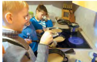
И даже мальчишкам интересно

ли то рисовую, то пшеничную, то гречневую муку. Добавляли сахар и соль по вкусу, молоко.