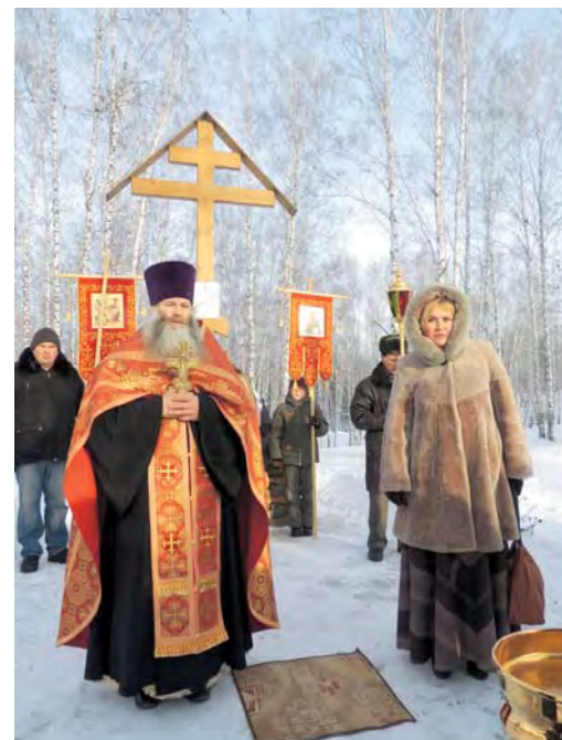
Лития у поклонного креста

Уже третий год в престольный праздник верующие совершают крестный ход до поклонного креста. Вот и нынче, несмотря на мороз под 30 градусов, прихожане про-