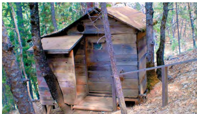
Келья отца Серафима (Роуза)

После крещения Юджин познакомился с выпускником Свято-Троицкой духовной семинарии в Джорданвилле