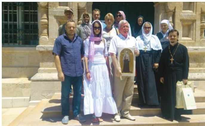
У мощей святой Елисаветы

обезличиться в общей массе народов под названием гога и магога.