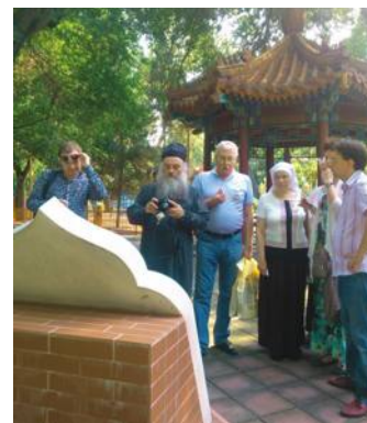
Пекин: здесь похоронены Великие князья

Вечером 18 июля вылетели в столицу Китая. Пекин – это город, где люди стремительно лишаются своей культурной самоидентичности. Здесь с особой остротой ощущаешь агрессию