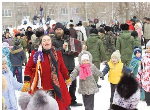
Народные игры на масленицу

Масленичная неделя – мясопустная («без мяса»). Скоромные продукты исключаются из пищи постепенно; на этой неделе уже не едят мяса, но всю неделю еще употребляют молочные продукты и рыбу.