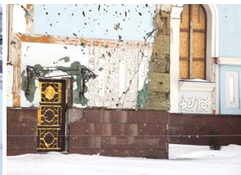
На улицах Луганска

транспорт и охрану для поездки по Луганску.