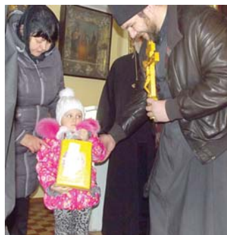
Олеся думала, что Деда Мороза убили на войне

По дороге от Изварино до Луганска уральцы увидели разрушенные города и села, сгоревшую боевую технику украинской армии – следы жесточайших боев. В Луганске также повсюду разгромленные дома, стоят