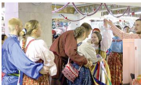
Семинар по народным танцам

В течение двух дней проходили мастер-классы, семинары, конкурсы ряженных и колядовщиков, вокалистов, игры, спектакли, хороводы, утренники и даже «пельменные помочи».