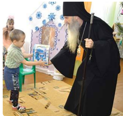
Мечты детей сбылись в Рождество