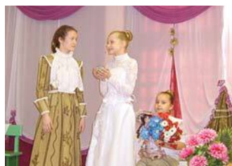
Дети играют для детей

Еще в детстве она получила от матери уроки истинного милосердия и сострадания, посещая вместе с ней госпитали, приюты, дома для инвалидов. Мать учила детей: «Пока человек чувствует