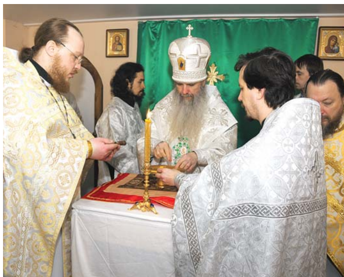
Владыка Мефодий освящает престол