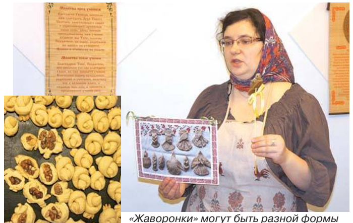
«Жаворонки» могут быть разной формы

По традиции в день 40 святых мучеников на Руси выпекали из теста образы жаворонков – предвестни-