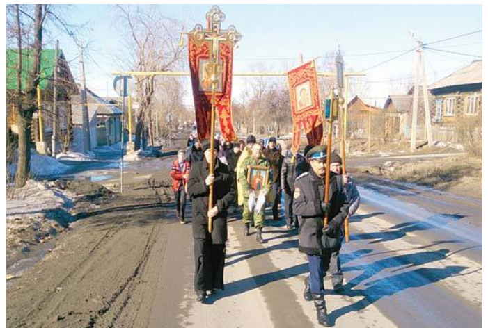
По улицам родного города прошли с молитвой

По завершении крестного хода участники долгое время не расходились из храма, согревались теплом