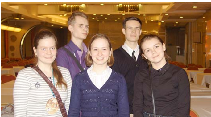
Команда «Симеон Верхотурский» на соревнованиях «Открытая лига»

19 марта в Каменске-Уральском состоялось награждение участников VII Общероссийской олимпиады по Основам православной культуры.