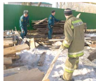
Пожарные помогают храму