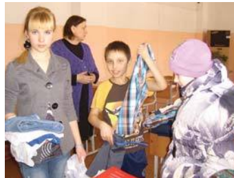
Раздача детских вещей

– Огромное спасибо за вещи, дети надели и не хотели снимать, так всё понравилось. Сейчас тяжёлое время для многих, но есть люди, для которых чужой беды не бывает. Очень приятно, что кому-то небезразлична судьба многодетных семей.