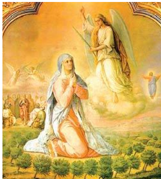
Явился Ей архангел Гавриил

Через три дня после погребения прибыл в Иерусалим и отсутствующий апостол Фома. Он был очень опечален и всею душою желал поклониться Её пречистому