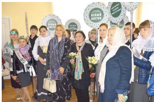
Участники благотворительной акции в Алапаевске

Праздник начался с молебна в Напольной школе, в той самой комнате, где в 1918 году Елисавета Феодоровна провела два последних месяца своей жизни.