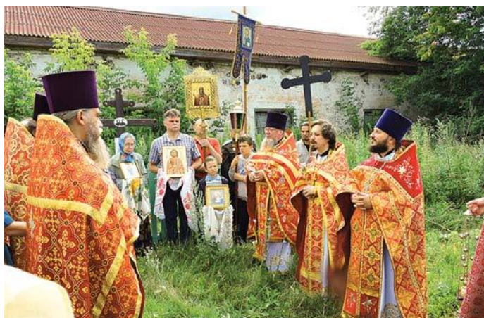
Молебен у могилы мучеников (с. Колчедан)

21 июля в с. Травянском Каменского района жители села и гости почтили память священномученика Александра Попова и с ним пострадавших восьми мирян. После Литургии они прошли крестным ходом до могилы мучеников.