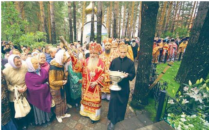
С пением Херувимской прошли вокруг шахты