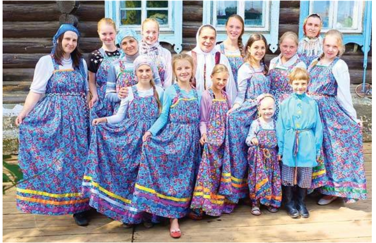
Ребята в лагере многому научились

Исеть на катамаранах и ночная военно-патриотическая игра «Горлица». Также ребята постигли основы фотосъемки и участвовали в православном квесте.