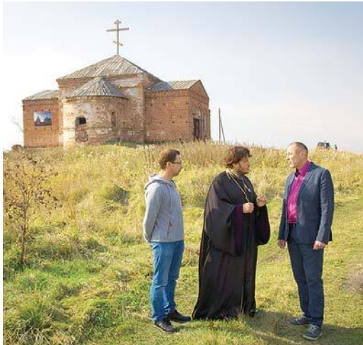
Съемки в селе Таушканском

Он получил грантовую поддержку международного конкурса «Православная инициатива 2014-2015». В съемках принимают участие представители творческого объединения «Уральские пельмени».