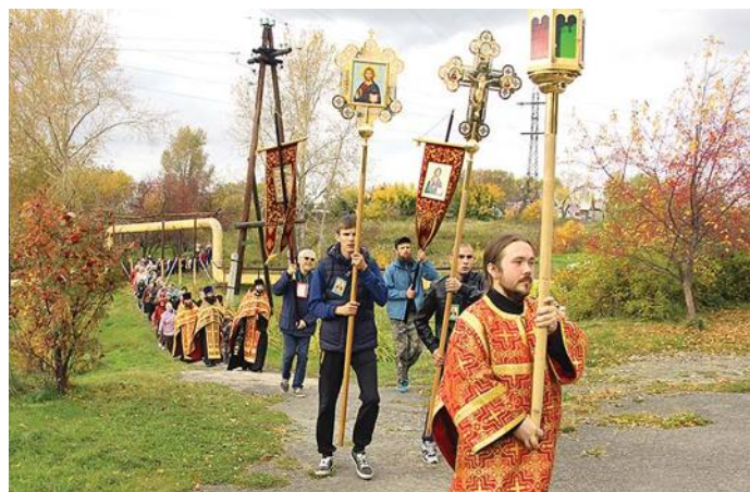
Крестный ход собрал множество горожан

11 сентября по улицам Алапаевска прошел крестный ход, посвященный недужным от страсти пьянства, наркомании и прочих зависимостей. Массовое шествие было организовано РОО «Уральское землячество» (г. Москва) при поддержке Каменской епархии и горадминистрации.