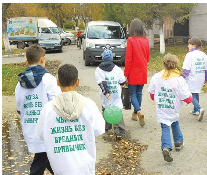
Дети раздавали листовки