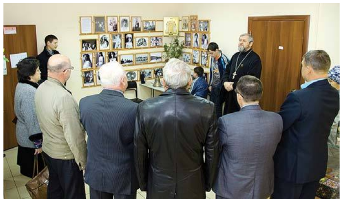
На церемонии открытия

С интересом гости познакомились с выставкой. На