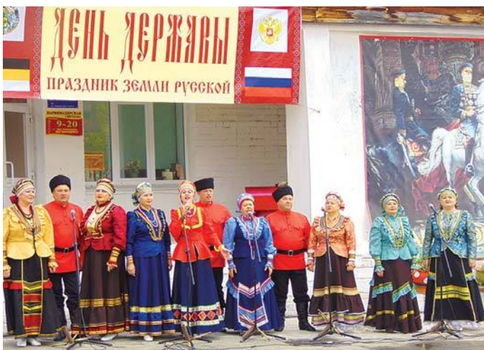
На празднике в Кочневском