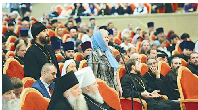
Вопросы во время работы съезда

лидам, сиротам, пожилым и многодетным. Всего в Церкви действуют более 400 групп милосердия и более 200 добровольческих объединений.