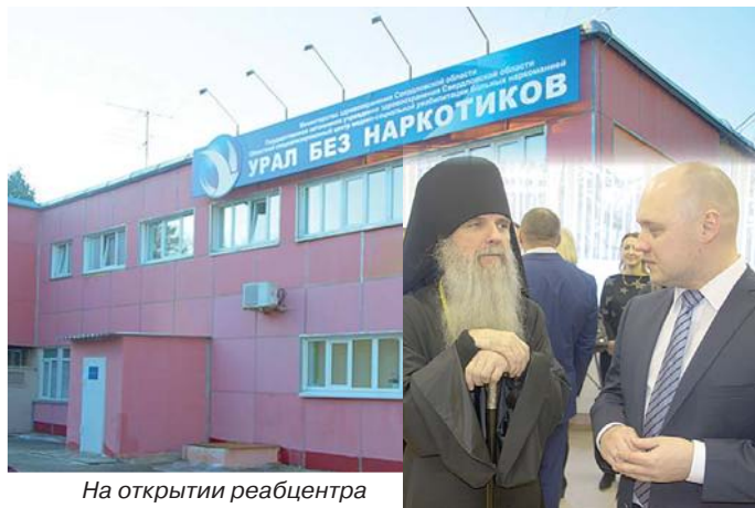
На открытии реабцентра