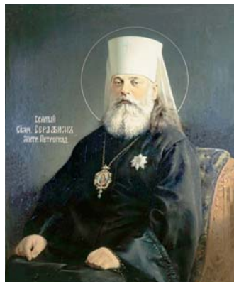
Святитель Серафим (Чичагов)

Патриарх Тихон для спасения его переводит на Варшавскую и Привисленскую кафедру, где не было власти большевиков. Но вследствие советско-польской войны священномученик Серафим пребывал в Черниговском скиту Свято-Троице-Сергиевой лавры до конца 1920 года. В 1921 году патриарх Тихон посвящает его в сан митрополита.