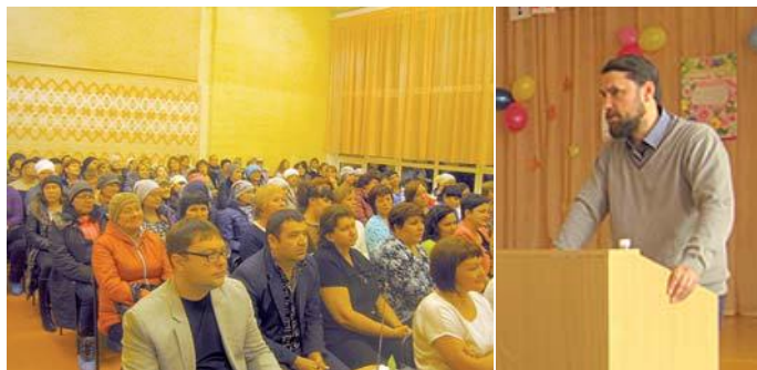
На родительском собрании

Во взрослой аудитории преподаватель акцентирует внимание на геополитических вопросах, связанных с демографией. Развенчивает мифы о перенаселенности планеты, созданные мировой элитой, раскрывает истинные причины и методы демографической и информационной войны, ведущейся против России. А начинается это разрушение с семьи – так подрываются устои государства.