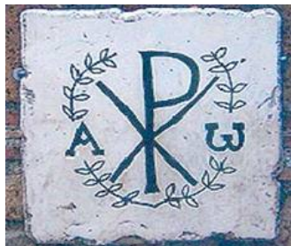
Монограмма имени Христа

Каким же образом икона указывает на святость человека, изображенного на ней?