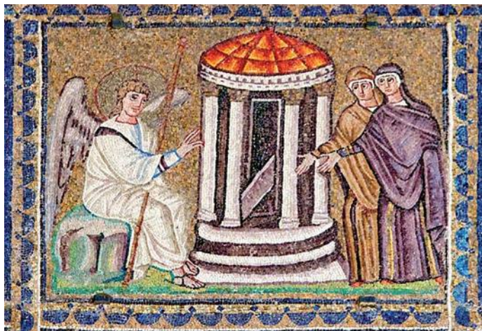
Жены-мироносицы и Ангел у гроба Господня – фрагмент мозаики из базилики города Равенна (Италия VI век)

Как изобразить духовный мир? Очевидно, только так, как это было выработано до тебя всем опытом церковной, т.е. духовной жизни во Христе. Церковный