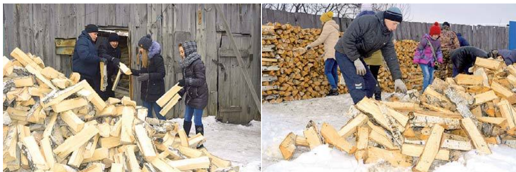
Волонтеры из медколледжа и Кисловской школы