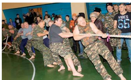
Самое зрелищное соревнование