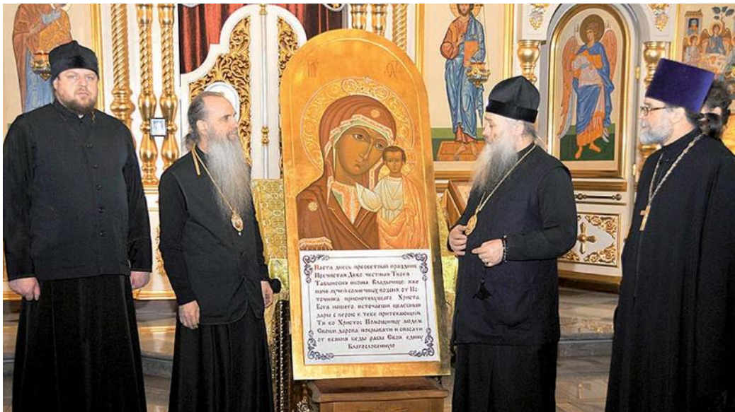
Передача иконы.