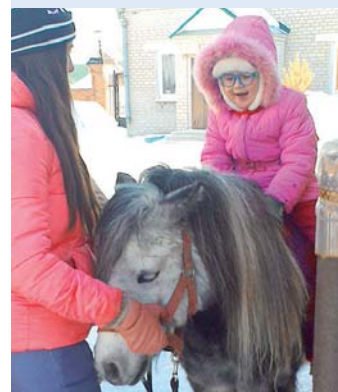
Покататься на пони