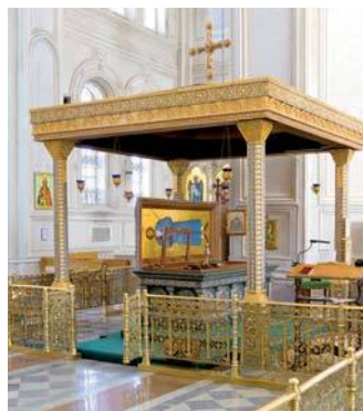
Сень над мощами св. Симеона

Главным небесным заступником уральской земли считается святой праведный Симеон Верхотурский и всея Сибири чудотворец.