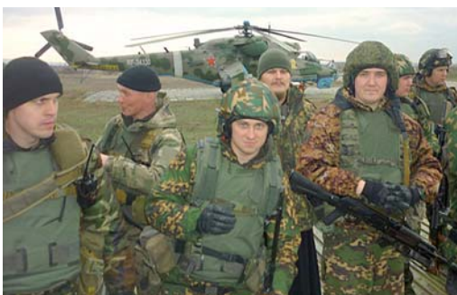
На тактических занятиях

В чеченских горах и лесах еще есть разрозненные группы, которые не хотят спокойно жить. Поэтому наши спецназовцы периодически уходят на задания. Возвращаются на базу, короткий перерыв, и снова в горы.