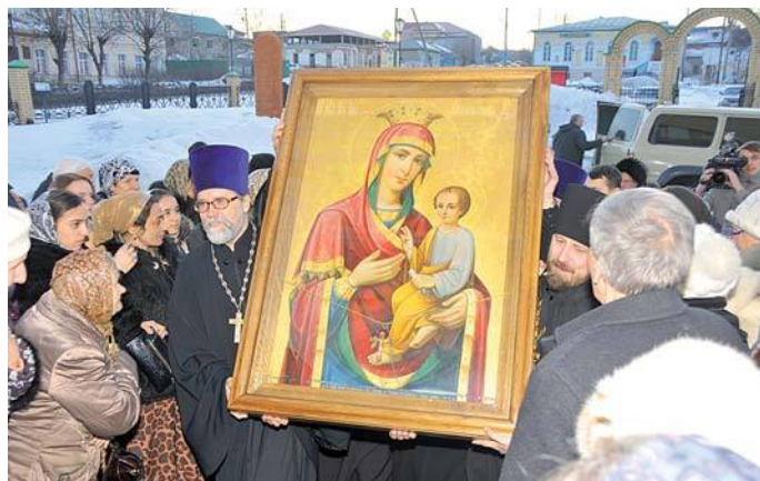
Встреча иконы на каменской земле

Говорят, что «Скоропослушница» слышит все наши прошения и скоро помогает. Как в XVII веке в афонском монастыре Дохиар впервые была явлена ее благодатная сила раскаявшемуся иноку Нилу, который на коленях всю ночь молил Пресвятую Деву о прощении. Пока не услышал голос: «Всем, с благоговением ко Мне прибегающим, буду предстательство, и молитвы всех будут ис-