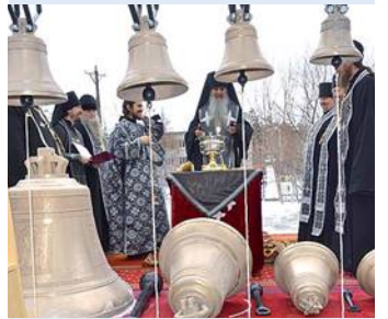
Владыка освящает колокола