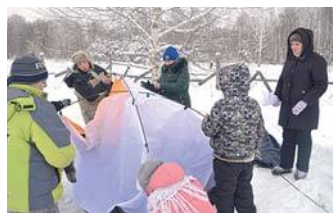
Учимся ставить палатку

Клуб «Степ», действующий на базе ДПЦ «Древо познания» по благословению про-