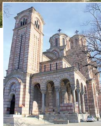
Церковь св. Марка (Белград)

За каждое испытание наши ребята были вознаграждены миром и радостью, светом и теплом Любви. А еще обрели духовный опыт, который помогает человеку взглянуть на многое по-новому, измениться к лучшему.