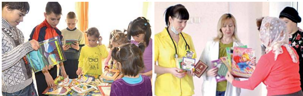
Детские книги с благодарностью приняли в приюте «Лада» (Каменск-Уральский) и ЦРБ Артемовского района

в отделение «Аленка» центральной районной больницы. В подарок пациентам добавили раскраски и пазлы. Приход во имя Серафима Саровского передал собранные книги в инфекционное отделение Артемовской ЦРБ в пос. Буланаш.