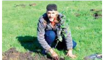
Дерево – в честь деда