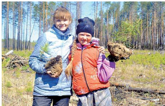
Сажали молодые сосенки