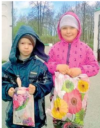
Получили подарки на Светлой седмице