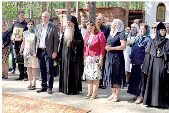
26 мая участники Международного форума побывали в Алапаевске

Министерство культуры постоянно занимается мониторингом предпочтений россиян. Сегодня желание духовного обогащения, познания духовно-нравственных святынь в разы превосходит пожелания пляжного отдыха. Открывая этот маршрут, мы хотели бы, чтобы он стал востребованным для самого широкого круга туристов, которые в отличие от паломников, только открывают для себя жизнь Великой княгини.