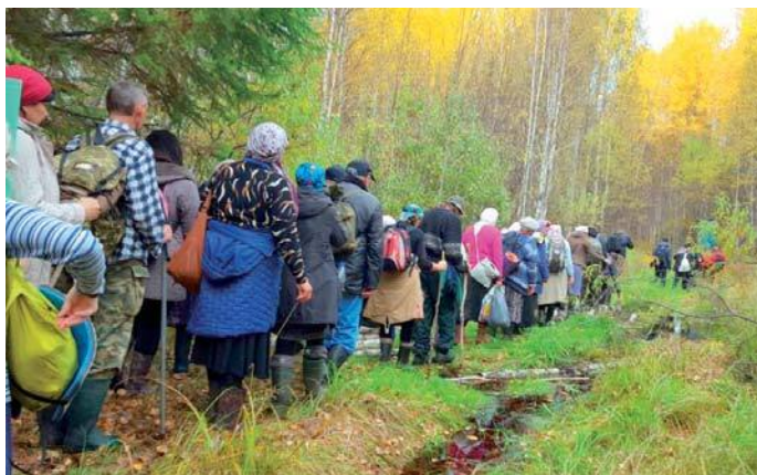
Через дремучий лес и болото

хотурцы. Всего на разных отрезках крестного хода участвовало до 120 человек.