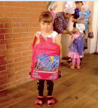
С новым портфелем

В результате собрано более 500 единиц канцтоваров, которые были распределены между четырнадцатью семьями. Помощь получили и дети беженцев с Украины, а двум школьникам удалось приобрести еще и портфели.