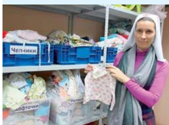
Вещевая и продуктовая помощь часто позволяет женщине избежать аборта или отказа от ребенка

Общецерковный сбор на нужды беременных и женщин с детьми, находящих-ся в кризисной ситуации, по благословию Патриарха Кирилла прошел в мае этого года – накануне Дня защиты детей. Собранные средства – 39 млн руб. – поступили на счет Синодального отдела по благотворительности. Они распределены в рамках открытого конкурса.