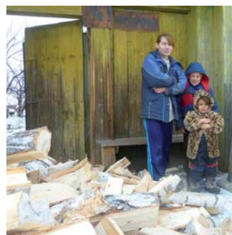
Дрова на зиму

тывает трех дочерей. Зарплата 3000 рублей, детское пособие и пенсия по потере кормильца. Вот весь доход. Плюс свой огород и козы. Летом девочки пасут