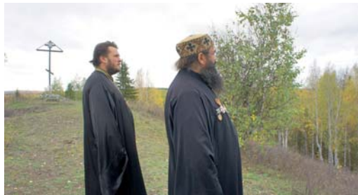
На Синей горе

Сотрудники краеведческого музея представили уникальные материалы, которые позволили запечатлеть вехи истории поселения в документах и фотографиях.