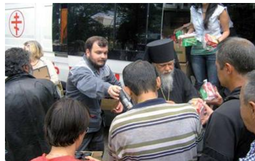
Раздача обедов бездомным

Основной задачей владыка считает планомерную и масштабную помощь семьям. Особое внимание он уделил использованию денежных средств и пожертвований на социальные нужды и оказание помощи – должна быть обязательная отчетность на всех уровнях. Владыка высказал свое мнение по вопросам корректного отношения работников Церкви к прихожанам.