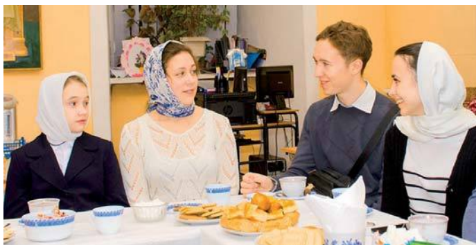
Встреча продолжалась более двух часов

не каждый день приходится общаться с архипастырем.