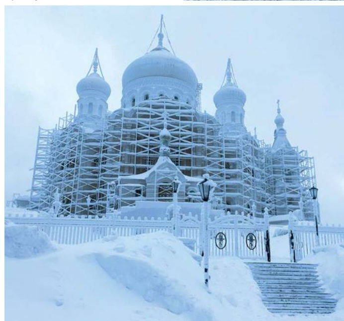
Морозные узоры Белогорья

и подготовка к юбилею идёт полным ходом.