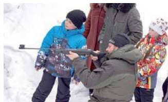
Батюшка показывает класс

Походный суп, приготовленный на костре, оказался очень вкусным. И сосиски исчезли мгновенно. Чай с блинами настроил на неспешную беседу. Говорили о наступающем Великом посте, его особенностях. Батюшка отвечал на наши вопросы и задавал свои.