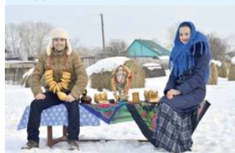
Фотосессия на пленэре