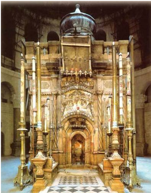
Кувуклия в храме Гроба Господня

К двери гроба по обычаю того времени привалили большой камень. Прообразом нахождения во гробе, указанным Самим Спасителем, является пророк Иона. Памятью предсказания Христа о Его Воскресении, первосвященники и фарисеи на следующий день пришли к Понтию Пилату и убедили его опечатать вход в пещеру и приставить к ней вооруженную охрану под тем предлогом, что ученики могут унести тело Учителя.