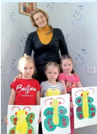
Нарисовали за час

Также проводятся встречи с детьми и их родителями «Мама на час». Занятия с детьми, которых приводят на причастие, начинаются с молитвы «Отче наш» и заканчиваются «Достойно есть».