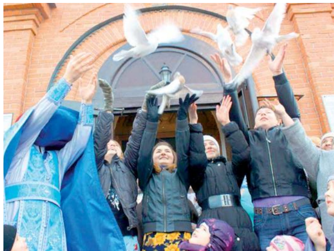
Выпускаем голубей на волю

Итак, когда мы на Благовещение выпускаем из клетки голубей и птиц на свободу, нашему духовному взору предстает величественный образ спасения души человеческой.