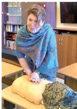
Тренировка на муляже