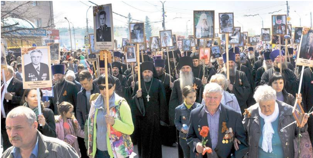
священники в колонне Бессмертного полка

Впервые среди 10 тыс. горожан в колонне Бессмертного полка в Каменске-Уральском прошли священники Каменской епархии. Они несли в руках фотографии священнослужителей – участников Великой Отечественной войны.