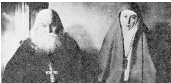
Гавриил (Зырянов) и Елисавета Федоровна Романова

Самостоятельная, особая и хорошо обособанная позиция батюшки по различным вопросам церковной жизни, а также относительно своего места служения не особо нравилась священноначалию. От него порой требовали то, что он просто не мог дать в силу своеобразия своей духовной и пастырской натуры,