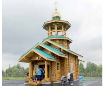
Новый храм в Асбесте