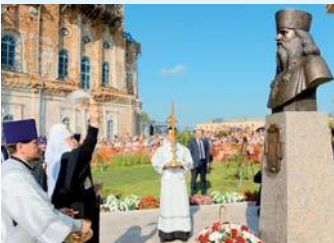
Памятник в с. Батурино

В храме в честь иконы Божией Матери «Всех скорбящих Радость» Патриарх Кирилл поклонился честным мощам преподобного Далмата Исетского.