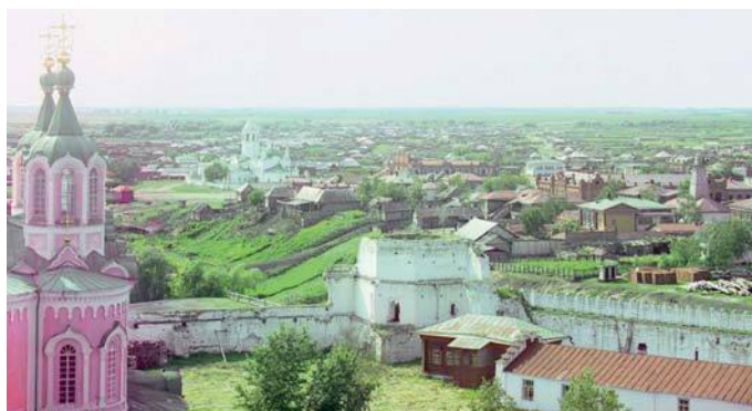
Вид Далматово с колокольни монастыря (на заднем плане – Николаевская церковь). Фото С. М. Прокудина-Горского, 1912 г.

В с. Затеченском звонили в колокола или по причине