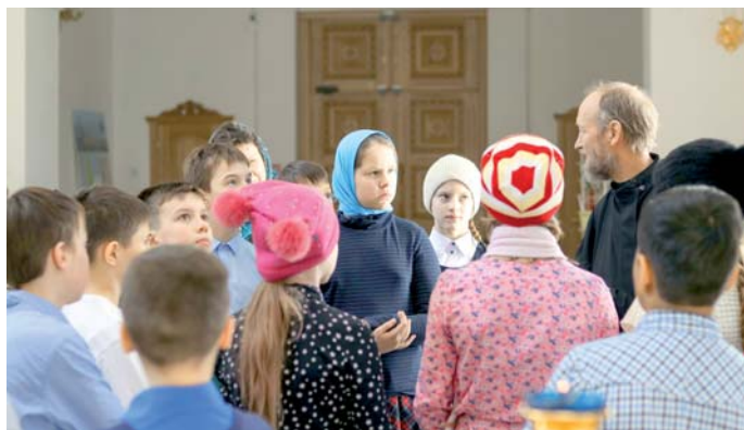
На экскурсии в храме