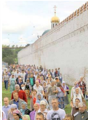
Освящение памятника святому Далмату Исетскому

ют на торжество обретения мощей св. Далмата, чтобы почтить память угодника Божия, так как он является покровителем и нашего города.