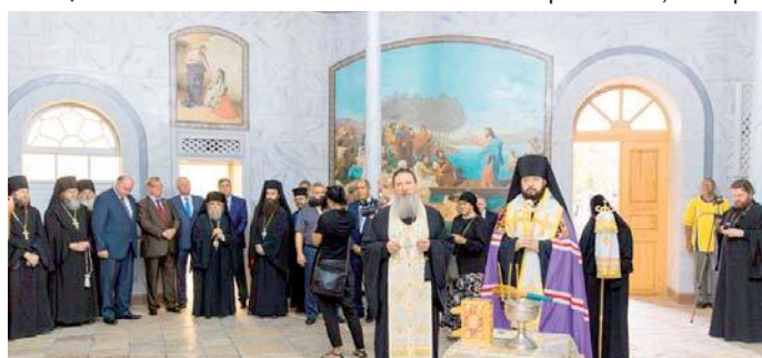
Торжественное открытие подворья

Несколько лет шла реконструкция, и вот 18 июля его торжественно открыли. День был выбран неслучайно: это память святого Сергея Радонежского – небесного покровителя Сергея Александровича. Также мы поклонились могиле архимандрита Антонина (Капустина), отдав дань уважения собирателю Русской Палестины.