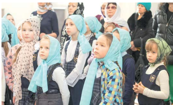
Дети – наше будущее

Духовно-просветительский центр призван распространять знания русской православной истории и культуры, возрождать христианские традиции в семье и обществе, осуществлять духовно-патриотического воспитание молодежи, формировать правильные моральные установки в моло-