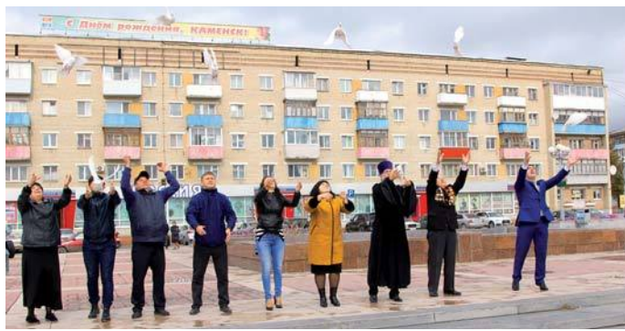
В небо летят голуби