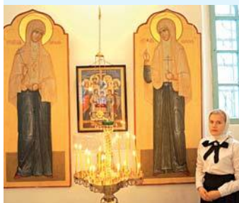
В архиерейском подворье

11 октября в 9 час. начнется Литургия в Свято-Троицком архиерейском подворье. В 12-20 состоится молебен на месте трагической кончины мучеников. Затем под пение Херувимской песни вокруг шахты на Межной пройдет крестный ход с мощами преподобномученицы Елисаветы и инокини Варвары.