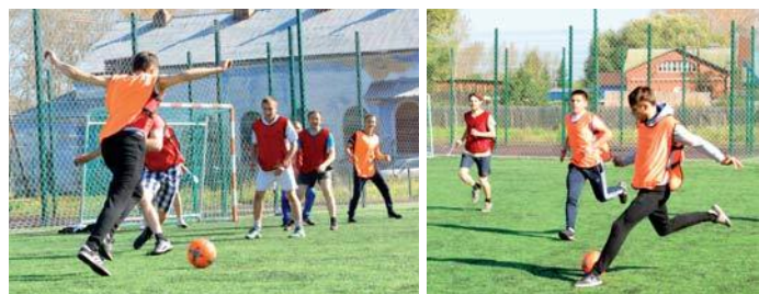
Жаркие баталии на поле

16 сентября в п. Пионерский Талицкого района на стадионе школы собрались помериться силами игроки 18 лет и старше. Команды состояли из прихожан и священнослужителей.