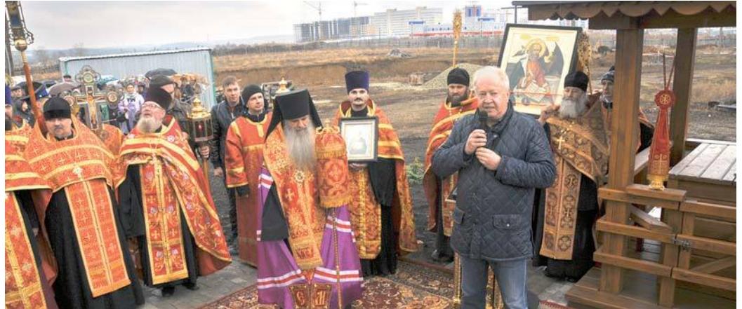
Общегородской крестный ход к месту строительства храма во имя Иоанна Богослова