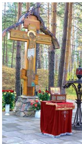
Поклонный крест у шахты

Здесь ссыльных разместили в местной Напольной школе на окраине города. Надзор за арестованными был возложен на Алапаевский совет рабочих и крестьянских депутатов и Чрезвычайную следственную комиссию.