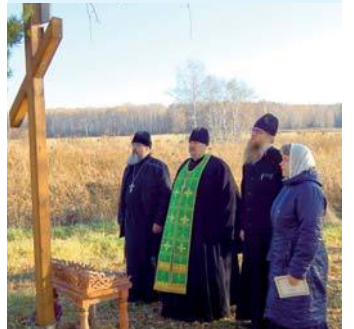
На родине прп. Гавриила

В завершении своего слова батюшка сказал: «И мне думается, что не без промысла Божия так устрои-