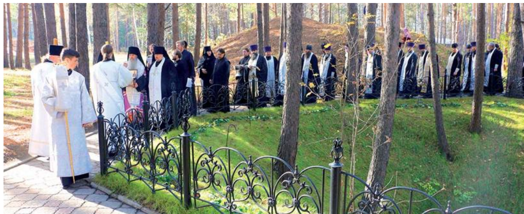
Крестный ход вокруг шахты с пением Херувимской