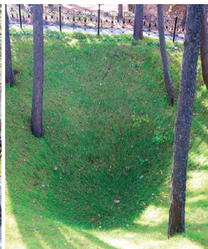
Шахта – место убийства

Первое время пребывания в городе режим заключения был относительно свободен. Всем заключённым были выданы удостоверения личности с правом передвижения «только по Алапаевску», для выхода из здания было достаточно уведомить разводящего караула.