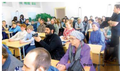
На открытии семинара в п. Нейво-Шайтанском

Главным объединяющим фактором стала Божественная литургия. После нее начались лекции, беседы, тренинги, в которых участвовали представители реабилитационного центра при приходе во имя апостолов Петра и Павла и жители посёлка Нейво-Шайтанский.