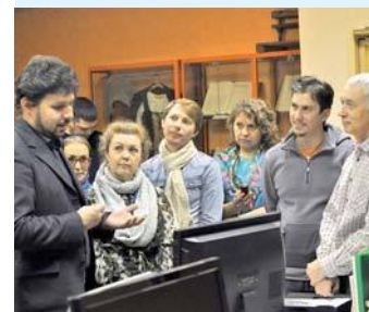
В учебной аудитории

Необходимые документы: паспорт; документ об образовании; 4 фото 3x4 см; справка от психиатра; справка от нарколога.