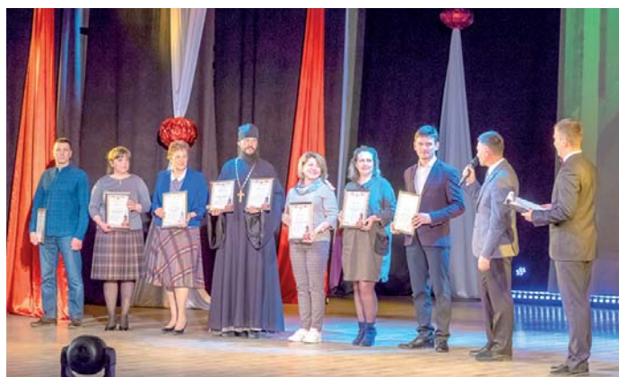
Благодарственные письма благотворителям