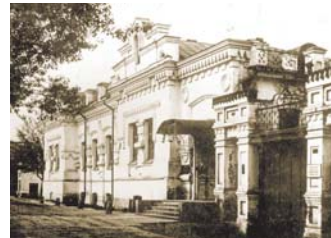
На месте дома Ипатьева возведен Храм-на-Крови

жали прежнее название ее земель, и оставляли по волю, как печать захвата, свои имена, – люди должны были знать, под чьей властью находятся они. Имена убийц, которыми названы улицы города, это знаки и вехи их владений. В земном плане их имена – психологическое насилие над совестью православного народа, в духовном – демоническая инициация города. Имя Свердлова означает, что палач России еще держит Урал в своей руке, подписавший смертный приговор царственным мученикам.