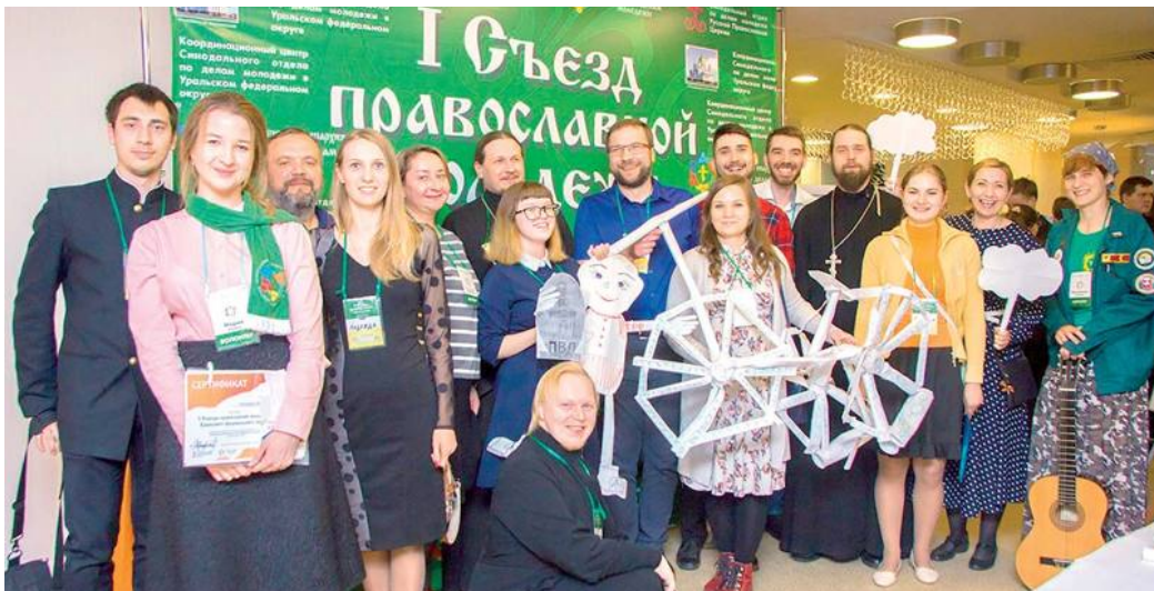
Презентация молодежных проектов