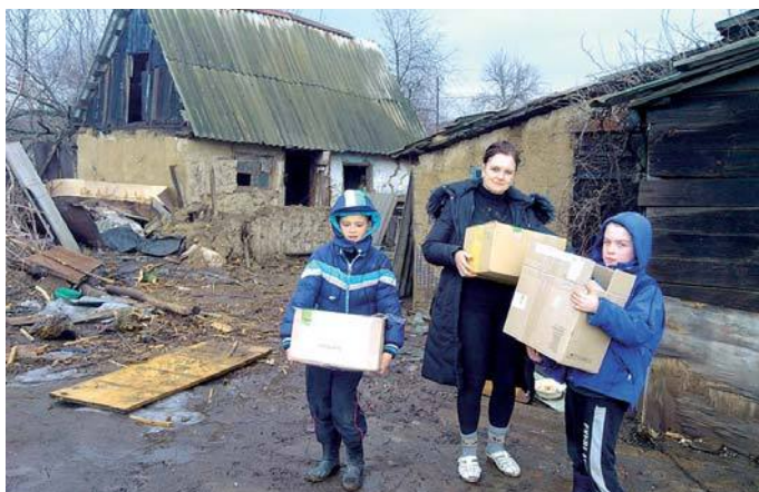
Краснодонцы благодарят за помощь

На вечере были вручены Благодарственные письма