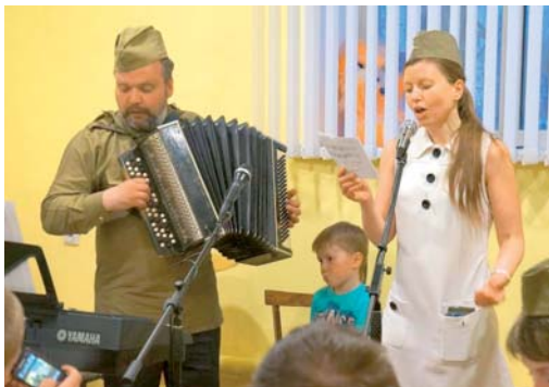
Песни дедов и прадедов