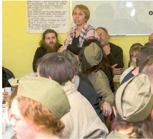
Воспоминания о фронтовиках

Многие в этот день обнажили свои души, со слезами на глазах поведав о близких людях – участниках войны. А потом мы все вместе под аккордеон пели любимые песни наших родных: «Смуглянка», «Старый