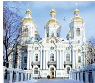
Никольский храм (Санкт-Петербург)