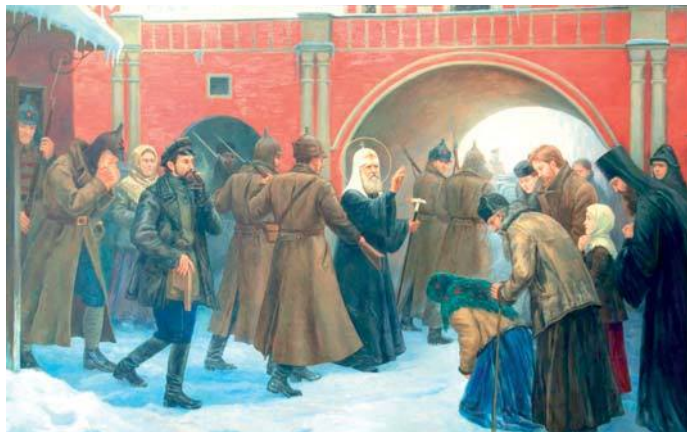
«Арест Патриарха Тихона». Филипп Москвитин