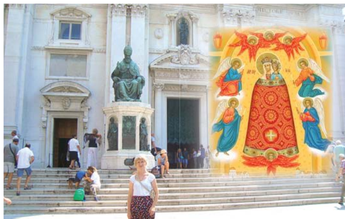
Здесь хранится часть дома Богородицы

путь тревогу, но его задержали силой. Двое юношей, барянин Маттео и некий француз Александр, разбили каменную крышку раки и вынули мощи св. Николая, которые буквально плава-