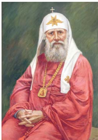
«Патриарх Тихон». Филипп Москвитин

В июле 1918 года в слове, сказанном по Еванге-