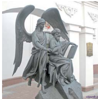
Памятник Иоанну Богослову

ли большое сопротивление проповеди святого апостола. Особенно устрашал всех надменный волхв Кинопс. Но великий Иоанн – Сын Громов – силой действующей через него благодати Божией разрушил все ухищрения бесовские, и гордый волхв бесславно погиб в морской пучине.