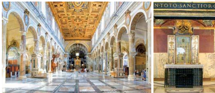
В церкви Божией Матери «Жертвенник небесный»