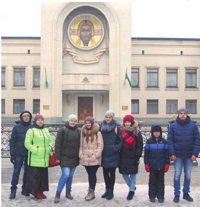
В Свято-Даниловом монастыре