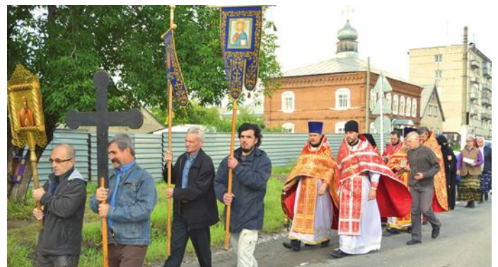
Крестный ход в день памяти колчеданских святых