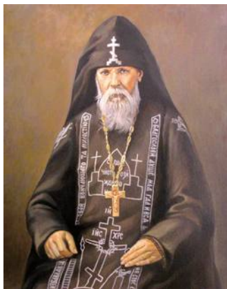
Преподобный Серафим Вырицкий

Вплоть до 1917 года Василий Николаевич оказывал Церкви материальную поддержку. Но когда вместе с революцией пришли