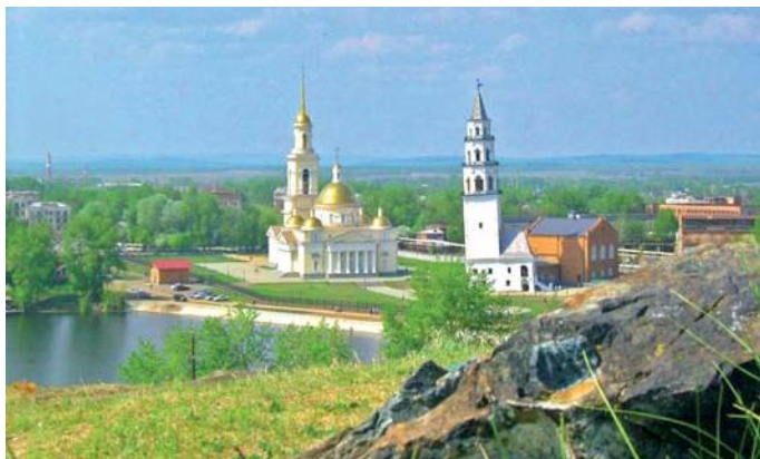
Невянский Спасо-Преображенский собор