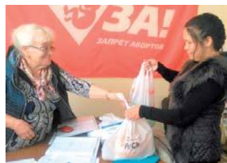
Раздача продовольственных наборов

Слава Богу, в нашем народе не иссякает доброта. От участия каждого из нас кому-то становится теплее,