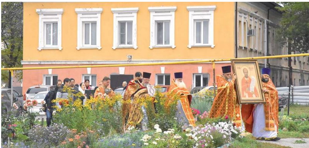
Крестный ход в Преображенском мужском монастыре