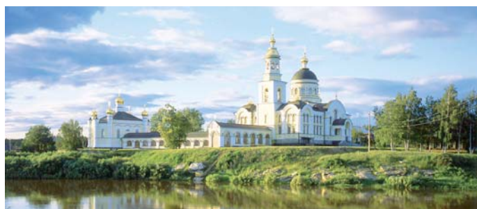
Храмы с. Меркушино – свидетели страшной расправы

В Меркушино виновными в организации восстания были признаны молодой священник с. Меркушино Констан-