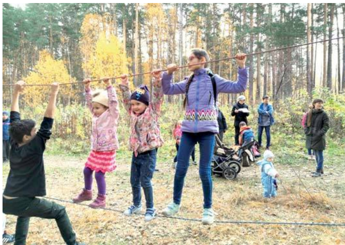
Первые уроки туризма