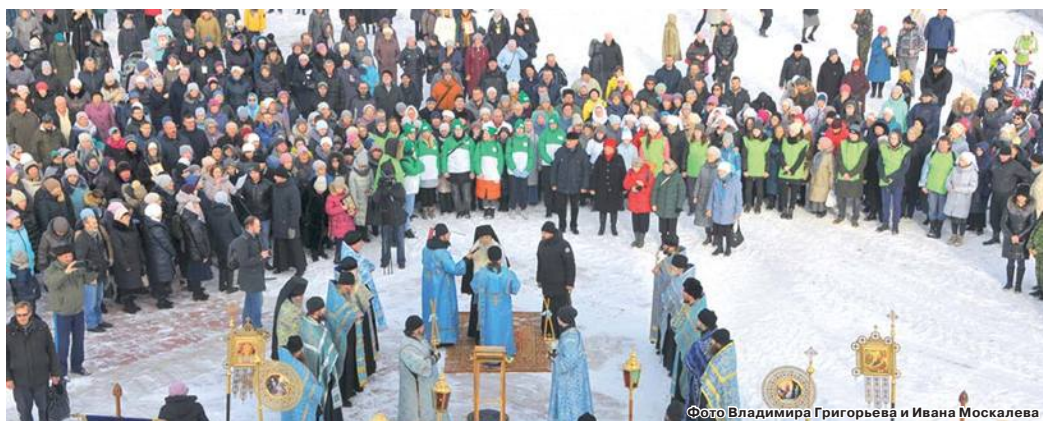
Крестный ход собрал жителей всех районов Каменска