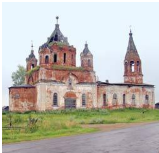
Троицкая церковь сегодня