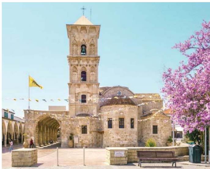
Церковь Св. Лазаря в Ларнаке (Кипр)