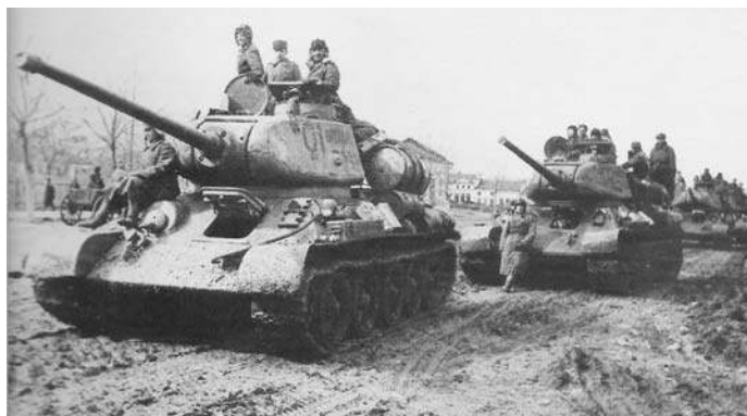
Танковая колонна «Дмитрий Донской»

Несмотря на это, за четыре года войны Церковь сумела собрать и передать в фонд обороны 300 млн руб, часть из которых поступила в виде церковных ценностей.