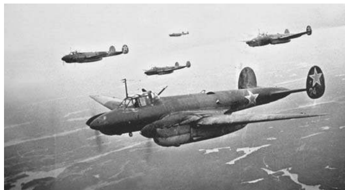
Авиационная эскадрилья «Александр Невский»

В 1941 году враг находился уже рядом со столицей, и положение было отчаянным. Тогда Сталин дал архиереям разрешение на облёт города с чудотвор-